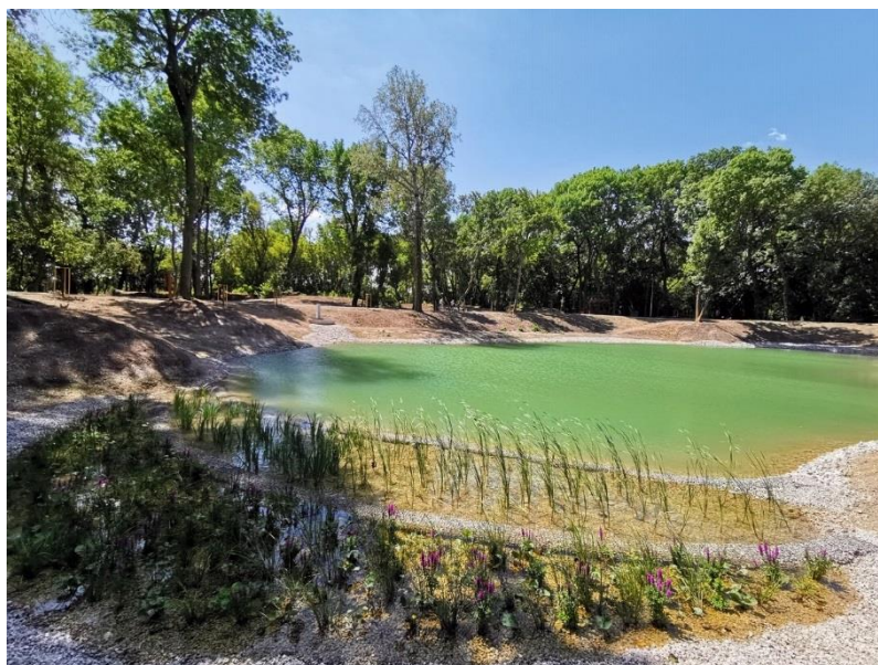
Pohľad na vodnú plochu s rozrasteným vodným a močiarnym rastlinstvom v 8/2019.