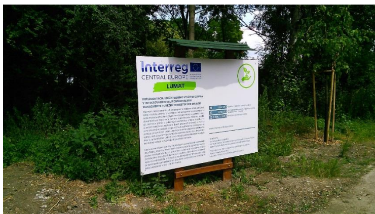
V zrevitalizovanej lokalite bola inštalovaná aj trvalo vysvetľujúca tabuľa s informáciami o projekte LUMAT.