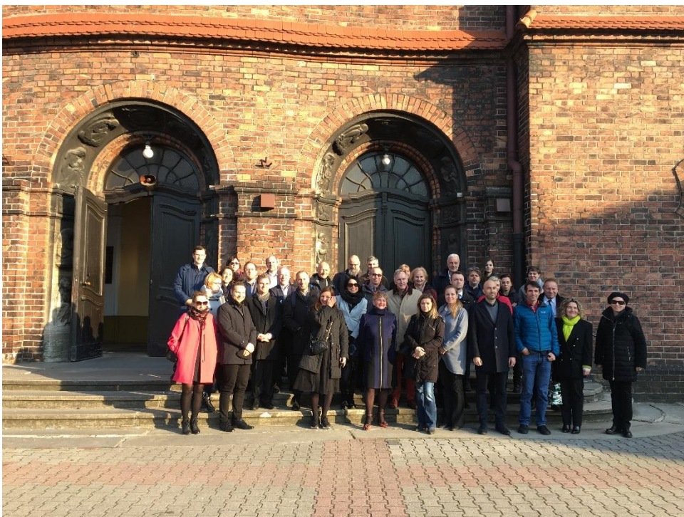
Fotografia projektových partnerov zo 6. zasadnutia Riadiaceho výboru projektu a Projektového partnerstva, ktoré sa spolu so Záverečnou konferenciou projektu konalo v 4/2019 v poľských Katowiciach.