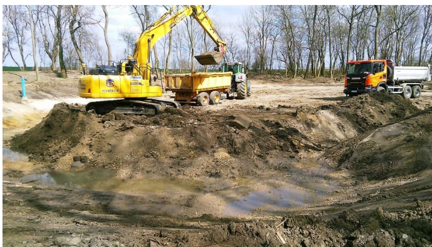
Pohľad na zemné práce pri hĺbení vodnej plochy v centrálnej časti revitalizovanej lokality lesíka Štrky počas 3-4/2019.