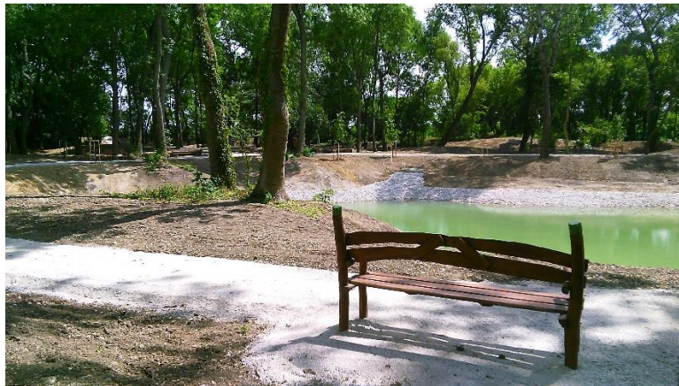
V zrevitalizovanej lokalite boli osadené aj ďalšie prvky drobnej architektúry – lavičky s operadlami.