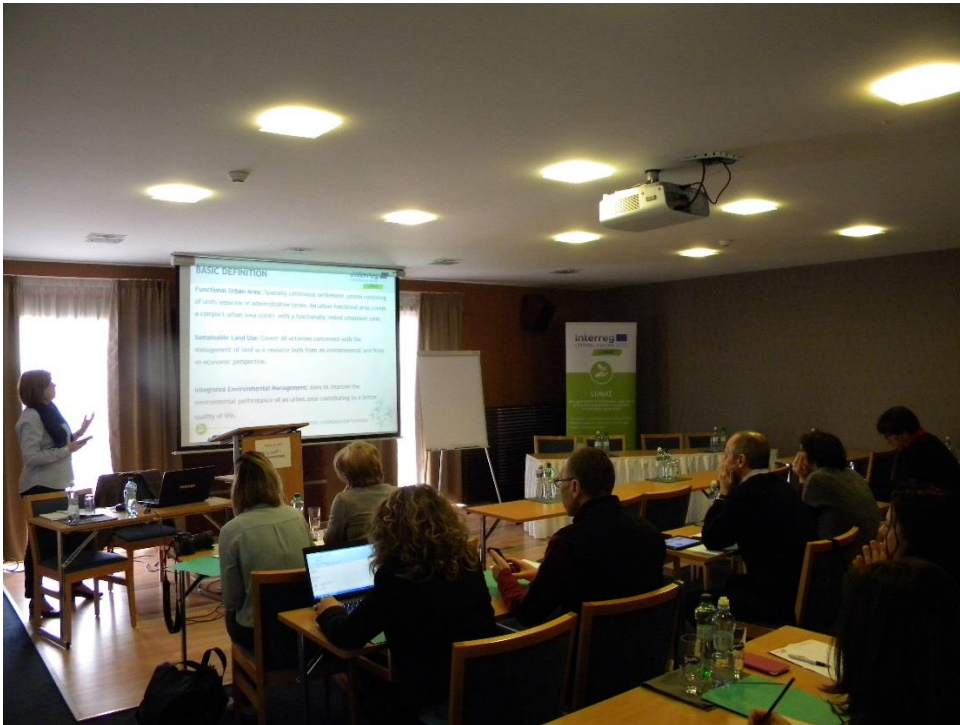
Fotografia z konania 2. zasadnutia Riadiaceho výboru projektu a Projektového partnerstva, ktoré sa konalo sa v 3/2017 v Bratislave a Trnave a ktoré organizovali slovenskí projektoví partneri (STUBA a mesto Trnava).

uvedených stretnutí si zástupcovia jednotlivých projektových partnerov prediskutovali aktuálny stav v implementácii projektu, prezentovali ťažiskové výstupy pre dané monitorovacie obdobie a dohodli si realizáciu nasledujúcich projektových aktivít.