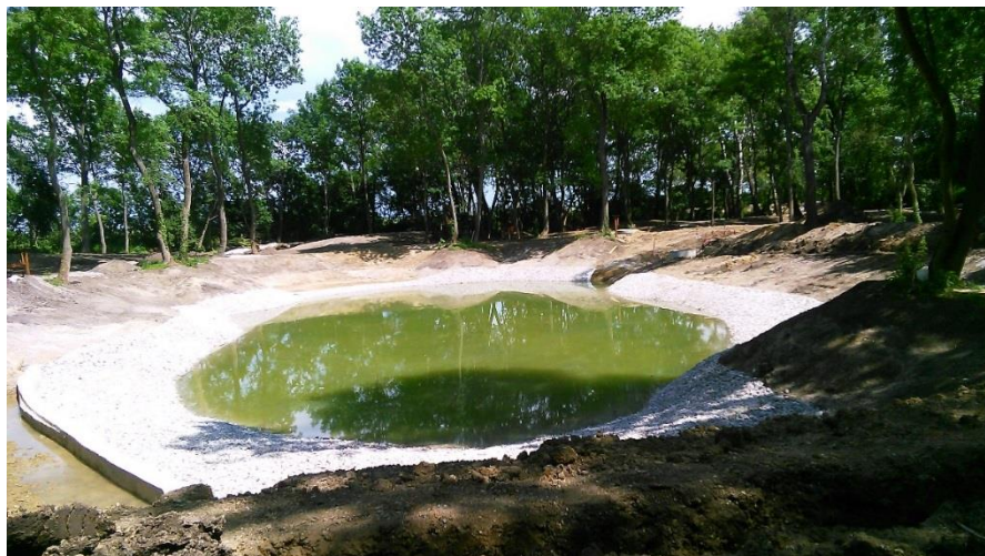
Pohľad na vyhlíbenú vodnú plochu pred jej dokončením v 5/2019.