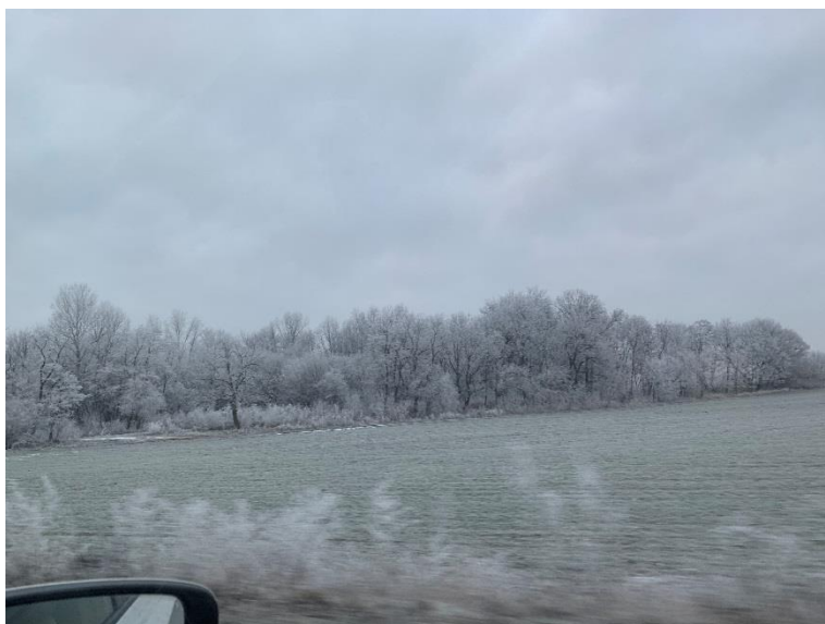
Pohľad na opustený lesík Štrky pred realizáciou pilotnej investície v rámci projektu LUMAT.