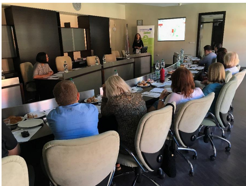
Pohľad na auditórium Národného tréningového seminára pre slovenských projektových partnerov, ktorý sa konal v 9/2018 v priestoroch trnavskej radnice a bol organizovaný v spolupráci STUBA a mesta Trnava.