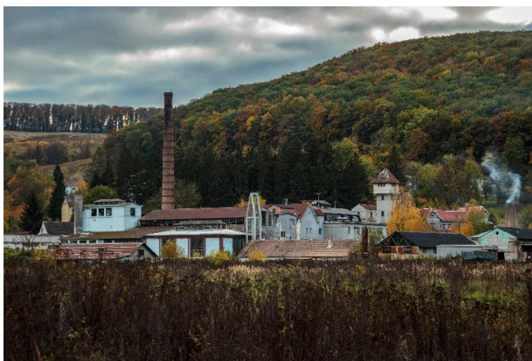
Slovenská fotografia prihlásená do fotosúťaže organizovanej v rámci projektu LUMAT, ktorá získala cenné 3. miesto.