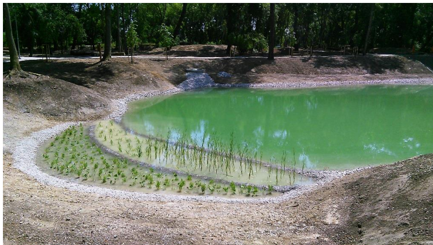
Pohľad na vodnú plochu v zrevitalizovanej lokalite lesíka Štrky s vysadeným vodným a močiarnym rastlinstvom - 7/2019.