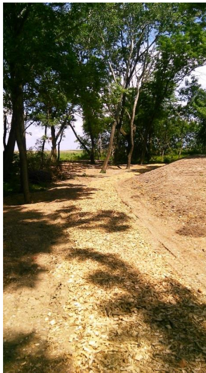
V zrevitalizovanej lokalite boli zároveň inštalované nové stĺpy verejného osvetlenia a vybudované prírodné chodníky z drevnej štiepky a drveného kameniva.