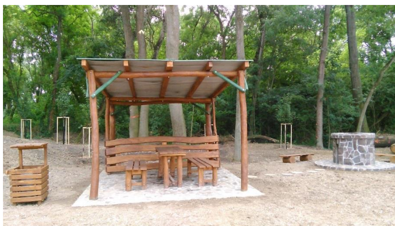
Pohľad na prvky drobnej architektúry - vybudovaný altánok s lavičkami, smetným košom a kruhovým kamenným grilom – 7/2019.