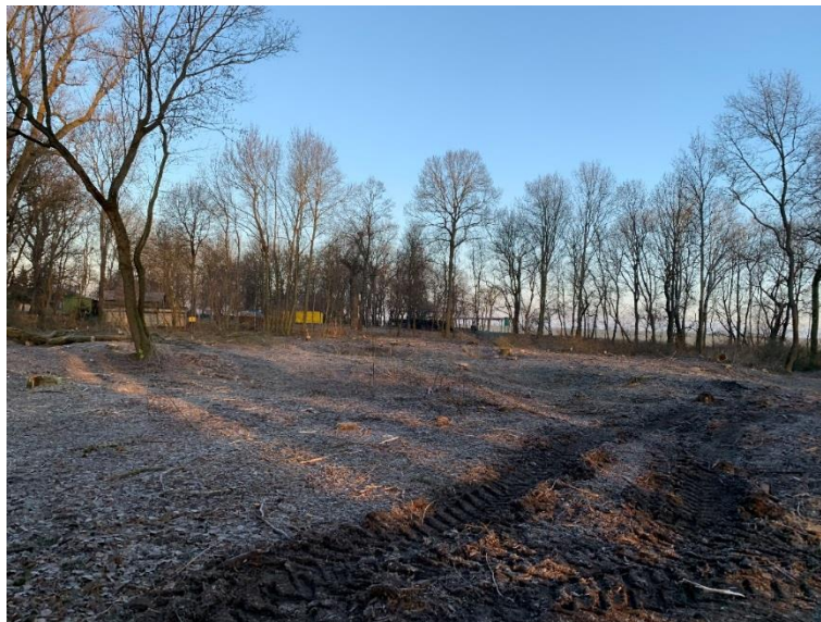
Pohľad na lokalitu lesíka Štrky v 3/2019 po jej vyčistení od divokých skládok odpadu, ako aj od chorých a invázných drevín, ktoré zatláčali pôvodne rastúce druhy stromov a krovín.